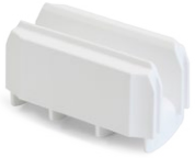
Joint amovible pour Max